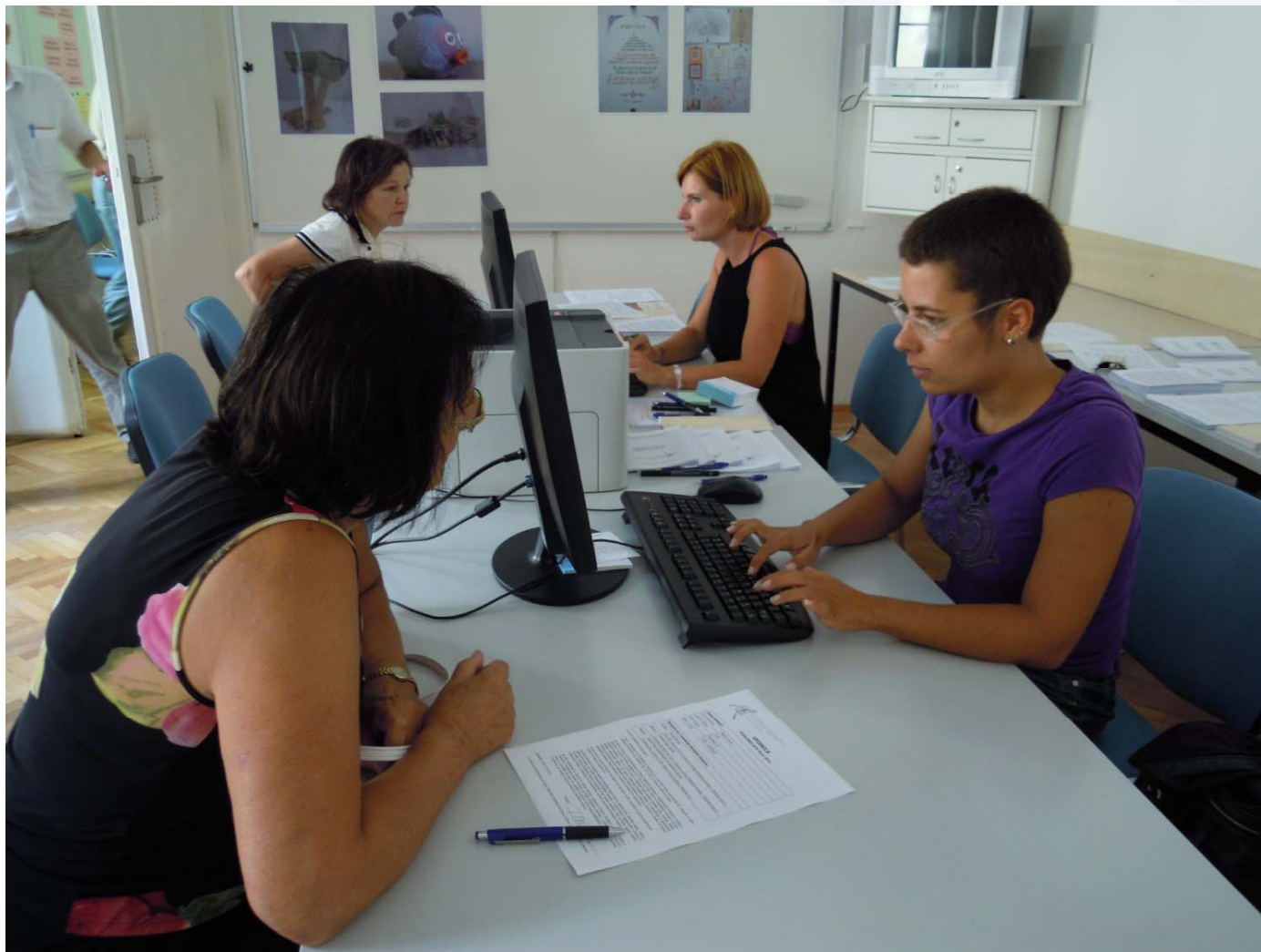
Svetovanje strokovnih delavk UTŽO Ljubljana med vpisi, september 2011.